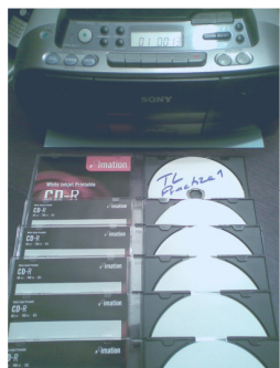
Mémorisation : CDs personnalisés