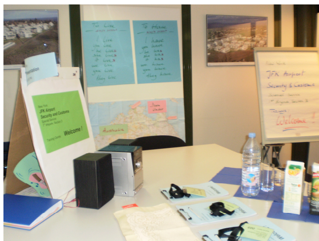
Expression : mise en contexte, visuels d'appui